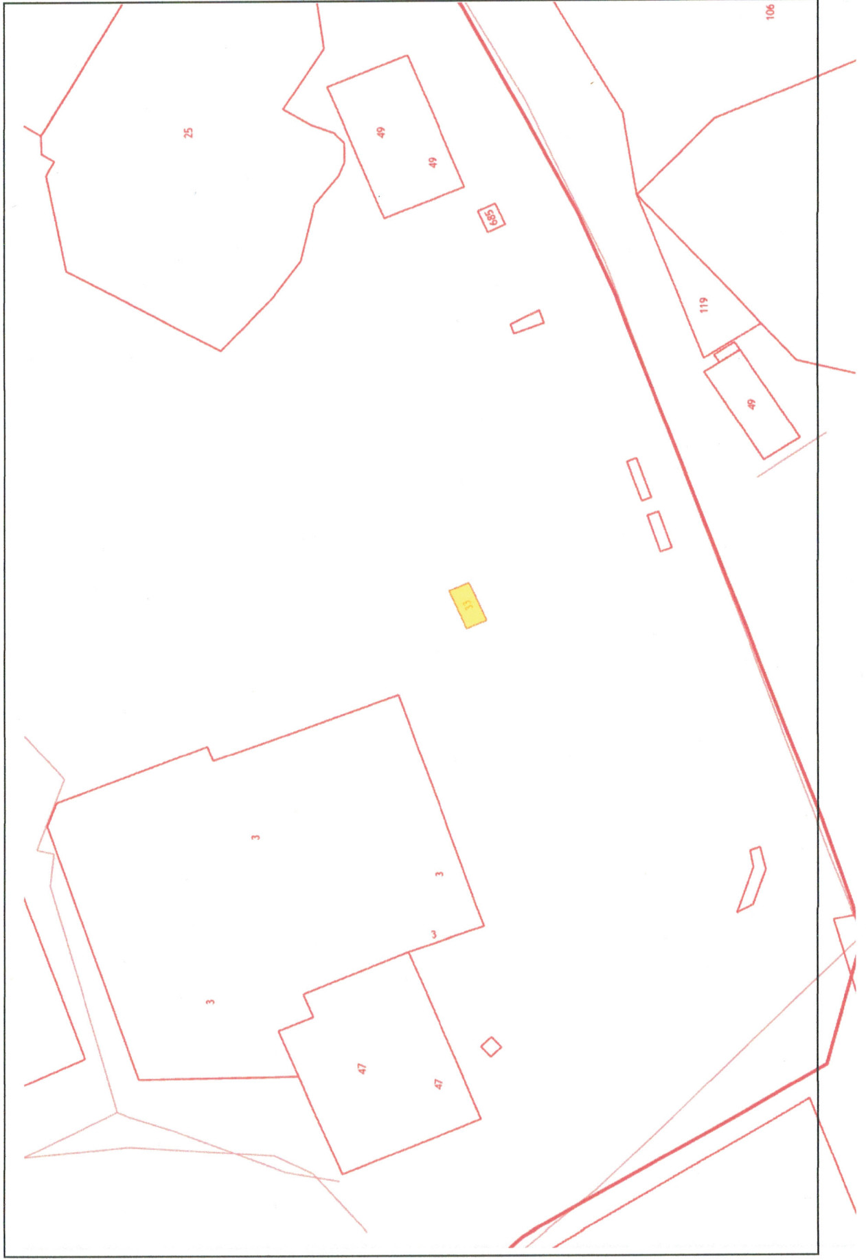
Схема расположения земельного участка с кадастровым номером 84:03:0020002:33, площадью 40 кв. м

Приложение к постановлению Администрации Таймырского Долгано- Ненецкого муниципального района от 05.04.2024 № 502